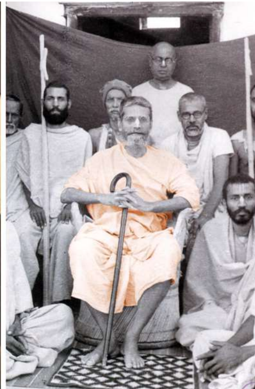
Bhakti Prajnan Keshava Goswami Maharaja (au milieu de chaque photo)