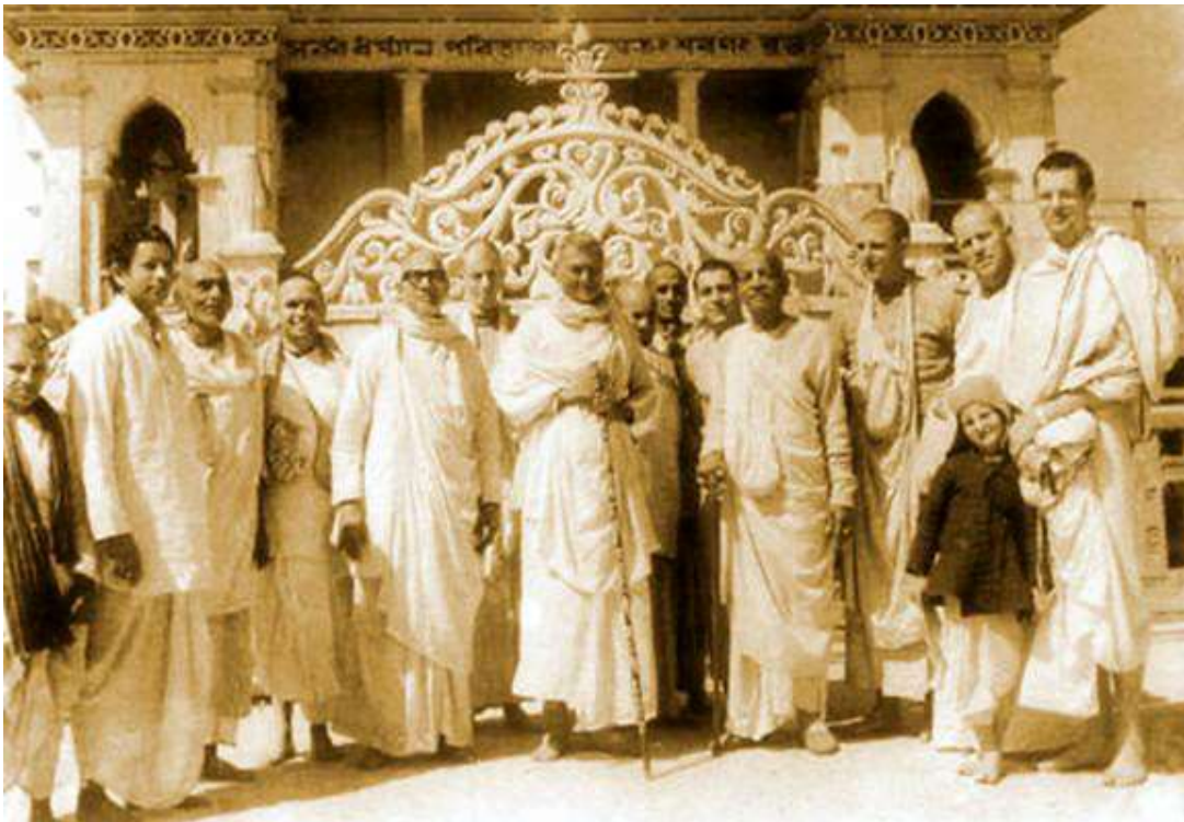
Srila Bhakti Raksaka Sridhara Goswami et Śrīla Prabhupāda