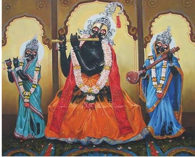
Toṭa Gopīnāth se tenant trois fois courbé, la déité de Gadādhara Paṇḍit à Purī Lalita-sakhi (à gauche) et Radhika, joue Sa kacchapi-vina.

Un jour Gadādhara sut que Nityānanda se trouvait à Purī; il l'invita à venir prendre le praśād de Toṭa-Gopīnātha. Nityānanda accepta son invitation et apporta du bon riz du Bengale pour offrir à Gopīnāth. Gadādhara cuisina le riz avec les feuilles et les légumes du Yameśvara-garden, et quand il offrit les aliments à la divinité, Mahāprabhu apparut également, lui procurant un grand plaisir. Tous les trois prirent joyeusement le praśād.