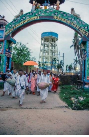
entrée du jardin Śrī Toṭa Gopīnātha

nityānanda gadādhara-bhikṣāra kāraṇe eka māna cāula āniñāchena ati sūkṣma śukla deva-yogyā sarva-mate gopīnātha lāgi' āniñāche gauḍa haite tabe randhanera kārya karite lāgilā āpane ṭoṭāra śāka tulite lāgilā keha bone nāhi—daive haiyāche śāka tāhā tuli' āniyā karilā eka pāka teñtula vṛkṣera yata patra sukomala tāhā āni' vāṭi tāya dilā loṇa-jala tāra eka vyañjana karilā amla-nāma randhana karilā gadādhara bhāgyavān e ānanda-bhojana ye paḍe vāśune kṛṣṇa-bhakti haya, kṛṣṇa pāya sei jane