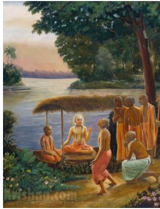
Gadādhara Paṇḍit s'évanouit

Quand ils arrivèrent tous à Cuttack (à 80 km), Mahāprabhu appela Gadādhara et dit : "Ta décision de rompre tes vœux et de quitter ton service est devenue une réalité. Si tu viens avec moi, cela te rendra heureux. Mais veux-tu ton bonheur ou le mien? Cela me rendra malheureux si ton vœu de rester à Purī et de servir Gopīnāth sont rompus. Si tu veux mon bonheur, retourne à Purī et reprends tes vœux. C'est tout ce que j'ai à dire."