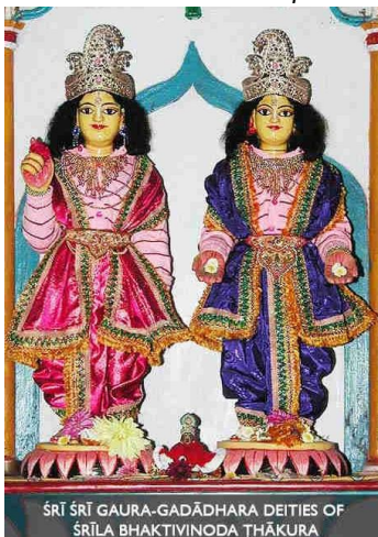
ŚRĪ ŚRĪ GAURA-GADĀDHARA DEITIES OF ŚRĪLA BHAKTIVINODA THĀKURA

jaya jaya nityānanda-gadādhara-jīvana / Jayādvaitādi bhaktera śaraṇa