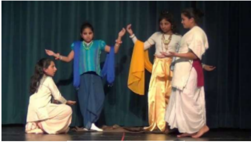
Clic ! THEATRE en anglais Clic !