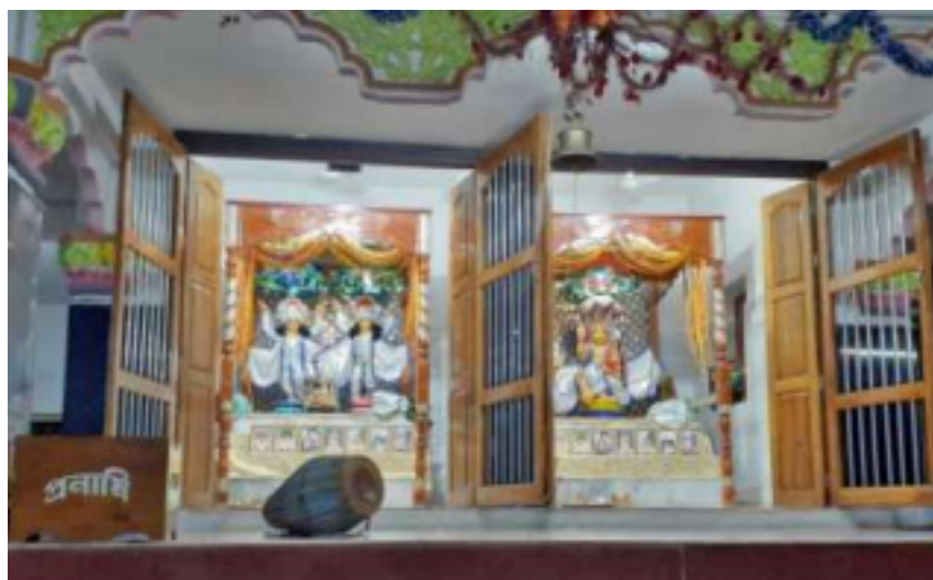
Nrsingha Palli à Ambika Kalna