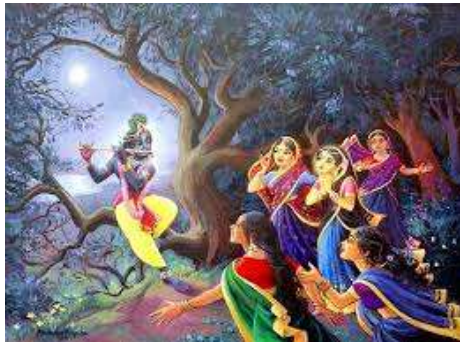
Gopi prema, l'amour le plus élevé

Nous voulons l'amour. Enfant, nous aimions d'abord notre mère, puis notre père, ensuite nos frères, puis notre famille, et ensuite nos voisins. Mais nous n'avons jamais trouvé la pleine satisfaction. Alors nous avons accumulé femmes et maris, puis à cause de notre insatisfaction, nous avons divorcé et échangé l'ancien pour du nouveau. Cependant, nous n'étions toujours pas satisfaits. Vous ne pouvez trouver satisfaction de cette manière. Personne ne le peut. Ce n'est que lorsque vous rencontrez Krishna et Le servez que vous pouvez être satisfaits. C'est une relation transcendante qui est donnée par le guru . Prabhupada a donné cela et cette relation existera pour toujours. C'est dans ce but qu'il a donné le mantra klim krsnaya govindaya .