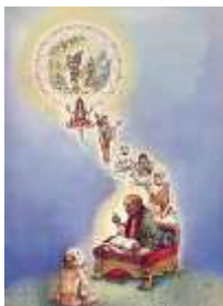
Notre Brahma Madhva Gaudiya sampradaya

Dans la personne de Srila Bhaktisiddhanta Sarasvati Thakura se trouve toute la connaissance que Krishna a donné à Brahma, que Brahma a donné à Narada, Narada à Vyasa et qui, grâce à la succession de maître à disciple, est descendue à travers les rupanuga-vaisnavas , les descendants de Srila Rupa Gosvami, jusqu'à Srila Bhaktivinoda Thakura et Srila Gaurakisora Dasa Babaji Maharaja. Tous les siddhantas , les vérités philosophiques, des Vedas , des Upanishads et de toutes les autres Ecritures furent personnifiées en Srila Bhaktisiddhanta Sarasvati Thakura. Quiconque essayait d'argumenter philosophiquement avec lui était vaincu d'avance et se trouvait finalement obligé d'accepter tous ses enseignements.