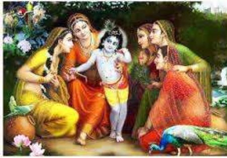
Krishna adoré comme un petit enfant

L'âme a une relation avec Krishna. Nous l'avons oubliée à cause de l'influence de Maya, mais cette relation existe bel et bien. Toutes les relations de ces corps matériels sont temporaires. Elles durent quelques jours seulement, mais la relation qui se trouve dans notre forme constitutionnelle est, elle, éternelle.