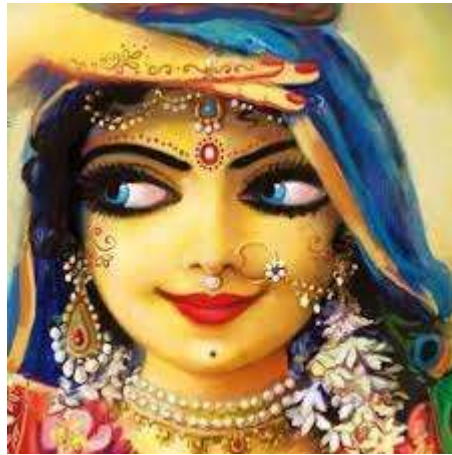
Les yeux de Srimati Radharani qui ne voient que Sri Krishna

Namah om visnupadaya krsna-presthaya bhutale. Il était très proche et très cher à Krishna dans sa forme masculine. Mais qui est-il réellement? Dans le second sloka de son pranama-mantra , il est mentionné: sri varsabhanavi-devi-dayitaya . Il est en vérité la servante éternelle de Srimati Radhika. Il est donc extrêmement cher à Radhika dans sa forme de Nayana Manjari. En tant qu'associé de Mahaprabhu, il est Bhaktisiddhanta Sarasvati Gosvami, et comme associé du couple divin Radha-Krishna, il est Nayana Manjari.