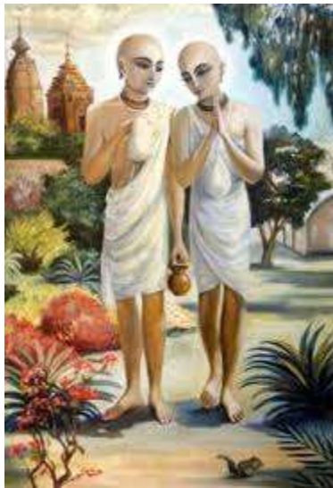
Sri Rupa et Sanatana Gosvamis

Sri rupanuga bhaktida . Srila Prabhupada est descendu en ce monde, de même que tous nos acaryas dans la succession de maître à disciple, simplement afin de prêcher la philosophie rupanuga-vaisnava . Mais ils n'avaient pas le temps. Depuis le début, j'ai donc évité de défricher la jungle, parce que notre guru-varga l'avait déjà fait. Je considérais que je devais plutôt répandre cette philosophie vaisnava .