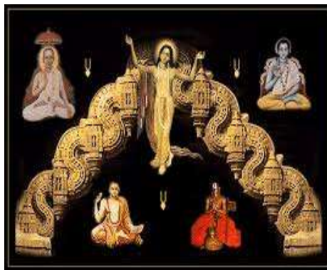
Sri Caitanya et les 4 sampradayas acaryas

Quelle est la signification du nom Nayana-manjari? De même que nos yeux nous sont très priya , très chers, Nayana-manjari, qui est la personnification des yeux de Srimati Radhika, Lui est très proche et très chère. Elle sert constamment Srimati Radhika. Il a donc deux formes. L'une en tant qu'associé de Caitanya Mahaprabhu, comme nous le connaissons à Navadvipa-Mayapura, pas seulement dans ce monde mais aussi dans le monde spirituel (Goloka-Vrindavana), et plus précisément à Svetadvipa. L'autre forme est à Vrindavana, comme Nayana Manjari. Vous avez vu dans le Vilapa-kusamanjali de Srila Raghunatha Dasa Gosvami comment les manjaris servent le couple divin Radha-Krishna. Nayana Manjari Les sert de manière similaire.