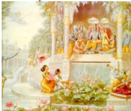
L'adoration empreinte de révérence du seigneur Narayana

Vient ensuite adhoksaja . C'est la connaissance de Vaikunthaloka, cet endroit où kala , le temps, n'existe pas. Il n'y a que l'éternel présent. Il n'y a ni naissance ni mort, ni souffrance ni peine. Rien de mauvais ou de désagréable. Dans ce royaume, il y a beaucoup d'opulence et tout le monde prie le Seigneur Narayana.